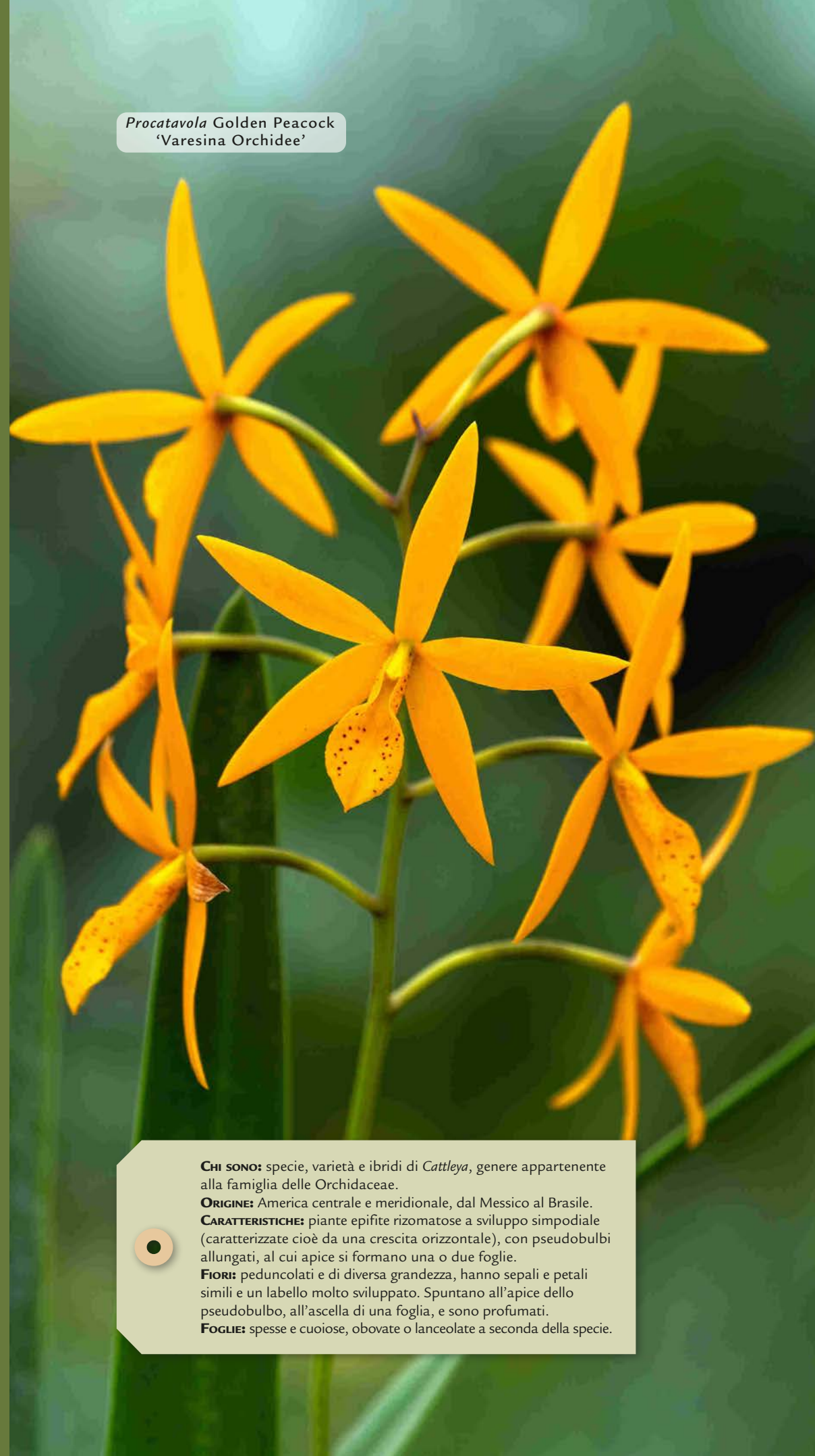
Procatavola Golden Peacock 'Varesina Orchidee'

CHI SONO: specie, varietà e ibridi di Cattleya , genere appartenente alla famiglia delle Orchidaceae. ORIGINE: America centrale e meridionale, dal Messico al Brasile. CARATTERISTICHE: piante epifite rizomatose a sviluppo simpodiale (caratterizzate cioè da una crescita orizzontale), con pseudobulbi allungati, al cui apice si formano una o due foglie. FIORI: peduncolati e di diversa grandezza, hanno sepali e petali simili e un labello molto sviluppato. Spuntano all'apice dello pseudobulbo, all'ascella di una foglia, e sono profumati. FUGLIE: spesse e cuoiose, obovate o lanceolate a seconda della specie.