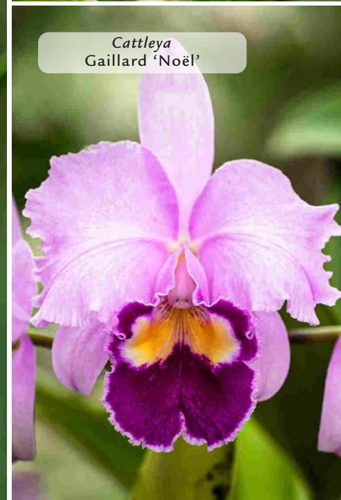
Cattleya Gaillard 'Noël'