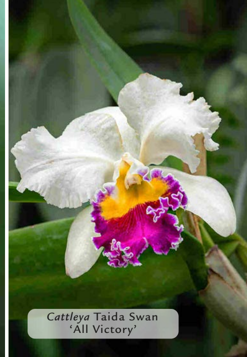
Cattleya Taida Swan 'All Victory'

CHI SONO: specie, varietà e ibridi di Cattleya , genere appartenente alla famiglia delle Orchidaceae. ORIGINE: America centrale e meridionale, dal Messico al Brasile. CARATTERISTICHE: piante epifite rizomatose a sviluppo simpodiale (caratterizzate cioè da una crescita orizzontale), con pseudobulbi allungati, al cui apice si formano una o due foglie. FIORI: peduncolati e di diversa grandezza, hanno sepali e petali simili e un labello molto sviluppato. Spuntano all'apice dello pseudobulbo, all'ascella di una foglia, e sono profumati. FUGLIE: spesse e cuoiose, obovate o lanceolate a seconda della specie.