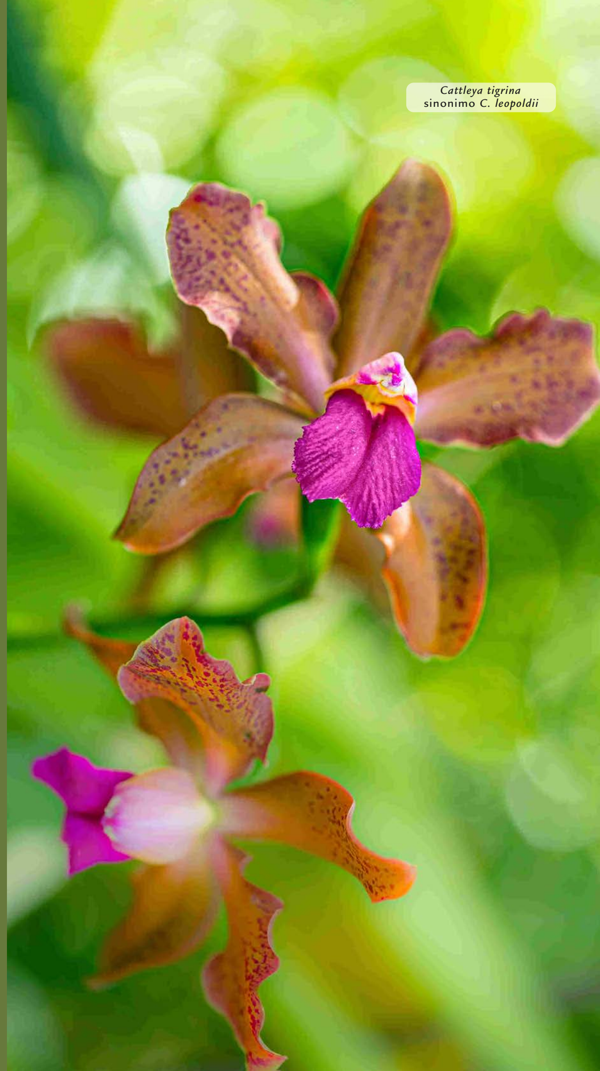
Cattleya tigrina sinonimo C. leopoldii