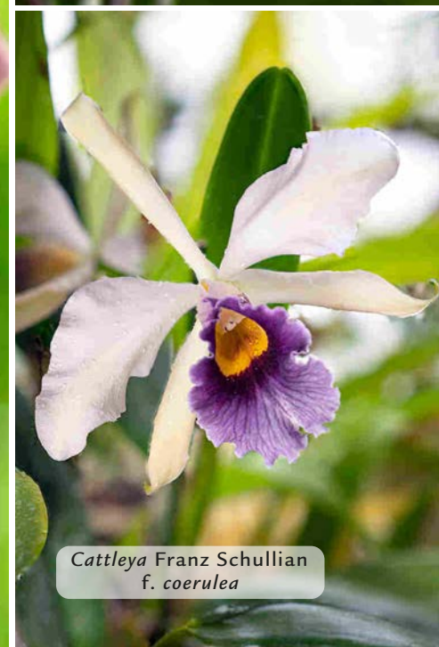
Cattleya Franz Schullian f. coerulea