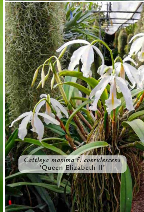
Cattleya maxima f. coerulescens 'Queen Elizabeth II'