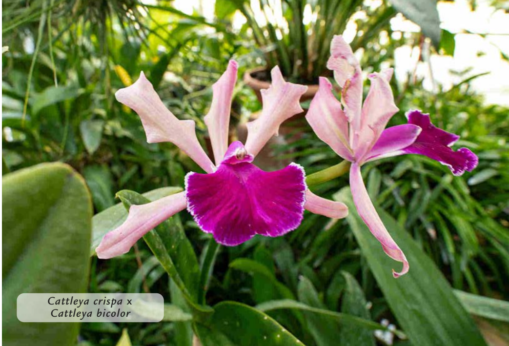
Cattleya crispa x Cattleya bicolor

Amanti della luce, queste orchidee richiedono bagnature frequenti e abbondanti