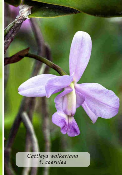
Cattleya walkeriana f. coerulea