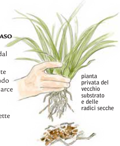
pianta privata del vecchio substrato e delle radici secche

Si estrae la pianta dal vaso, eliminando il substrato precedente degradato e tagliando le radici secche e marce con forbici affilate e disinfettate nella candeggina, che mette al sicuro da funghi, batteri e virus.