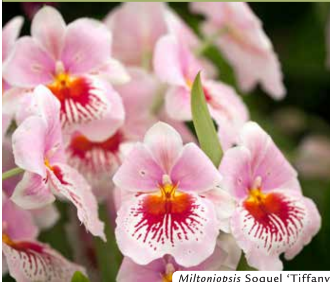
Miltoniopsis Soquel 'Tiffany'